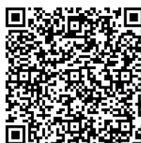
该二维码7天内(4月19日前)有效,重新进入将更新